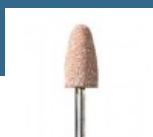
DREMEL Piatra de polizor de oxid de aluminiu 9,5 mm (952)