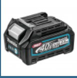
MAKITA BL4025 Acumulator LI-Ion, 40V XGT, 2.5Ah