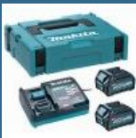
MAKITA Kit acumulatori Li-Ion, 40V XGT, 2.5Ah (MAKPAC + DC40RA + BL4025x2)