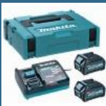
MAKITA Kit acumulatori Li-Ion, 40V XGT, 4Ah (MAKPAC + DC40RA + BL4040x2)