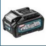
MAKITA BL4040 Acumulator LI-Ion, 40V XGT, 4Ah