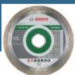
BOSCH Disc diamantat gresie 125 PROFESSIONAL