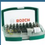
BOSCH Caseta 31 biti + adaptor X-Line