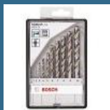
BOSCH Caseta 10 burghie metal HSS-G 1-10 mm