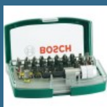
BOSCH Caseta 31 biti + adaptor X-Line