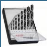
BOSCH Caseta 8 burghie lemn 3/4/5/6/7/8/9/10 mm