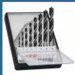
BOSCH Caseta 8 burghie lemn 3/4/5/6/7/8/9/10 mm