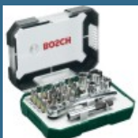
BOSCH Caseta 26 biti