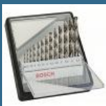
BOSCH Caseta 13 burghie metal HSS-G 1.5-6.5 mm