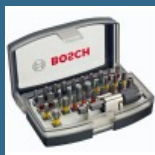
BOSCH Caseta 31 biti + adaptor