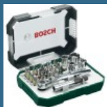
BOSCH Caseta 26 biti