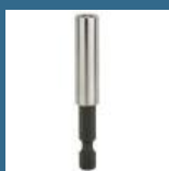
BOSCH Adaptor bit 54 mm