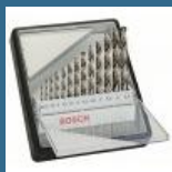
BOSCH Caseta 13 burghie metal HSS-G 1.5-6.5 mm