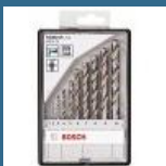
BOSCH Caseta 10 burghie metal HSS-G 1-10 mm