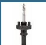
BOSCH Adaptor hexagonal carota 32-210