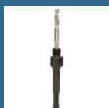
BOSCH Adaptor SDS-PLUS carota 16-32