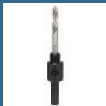
BOSCH Adaptor hexagonal carota 14-30