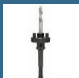
BOSCH Adaptor SDS-PLUS carota 33-152