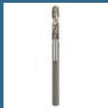
BOSCH Burghiu centrare pentru adaptor SDS-PLUS