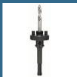
BOSCH Adaptor SDS-PLUS carota 33-152