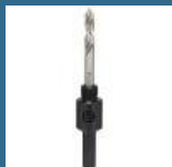
BOSCH Adaptor hexagonal carota 14-30