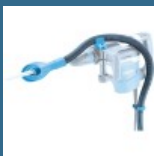
MAKITA Sistem de extractie a prafului pentru HM0871C