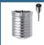
MAKITA Carota 65x100 mm