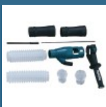
MAKITA Sistem de extractie a prafului pentru HR5212C