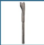
BOSCH Delta pentru canale SDS-MAX