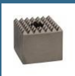
BOSCH Buciarda 60x60 mm SDS-MAX