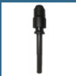
BOSCH Adaptor SDS-MAX/SDS-PLUS