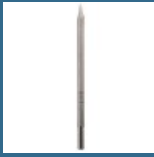
BOSCH Spitz 600 mm SDS-MAX