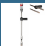
MAKITA Burghiu SDS-MAX cu extractie a prafului 35x400x600 mm