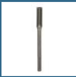
BOSCH Delta concava SDS-MAX