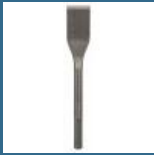
BOSCH Delta pentru ceramica SDS-MAX