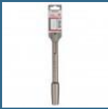
BOSCH Suport pentru buciarda si placa tasare SDS-MAX