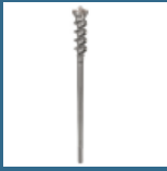
BOSCH Burghiu strapungere 55x450x600 mm