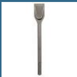
BOSCH Delta 350x50 mm SDS-MAX