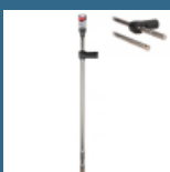
MAKITA Burghiu SDS-MAX cu extractie a prafului 28x700x900 mm