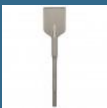
BOSCH Delta pentru asfalt SDS-MAX