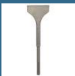
BOSCH Delta lata 350x115 mm SDS-MAX