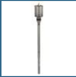
BOSCH Carota SDS-MAX 68x420x550 mm