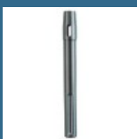
MAKITA Tija suport SDS-MAX 450 mm