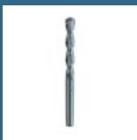
MAKITA Burghiu de centrare 11x120 mm