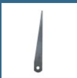
MAKITA Stift aruncator