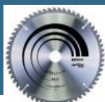
BOSCH Disc Optiline Wood 254x30x60T