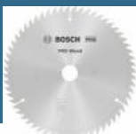
BOSCH Disc Optiline Wood 254x30x60T