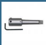
CROMWELL Adaptor con Morse No.2 MORSE TAPER ADAPTOR