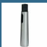
BOSCH Reductie con morse MK2-MK1